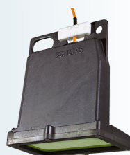
Philips Seacage 400W