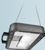
Philips Seacage 340W