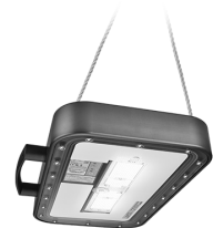
Philips Hatchery 340W