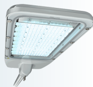
Philips Hatchery 250W