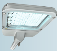
Philips Hatchery 125W