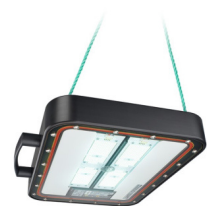
Philips Seacage 680W