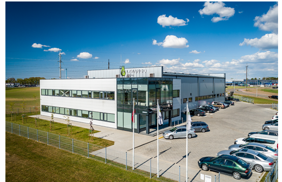
Smiðja Lavango í Litháen